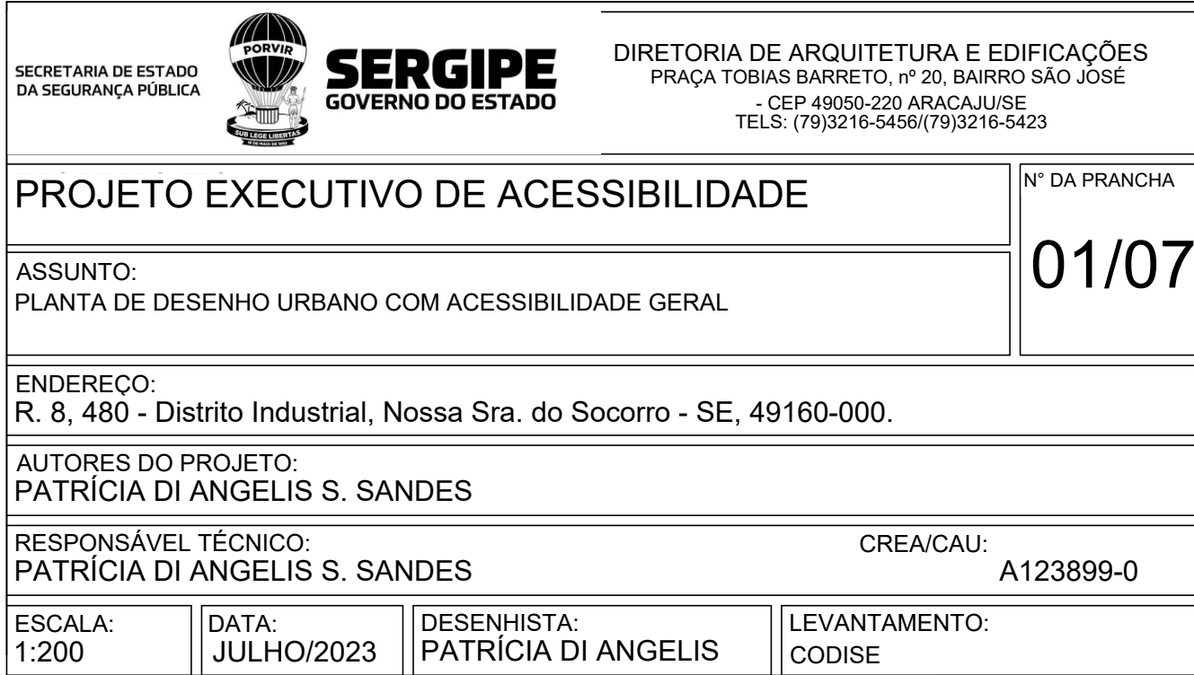
01 PLANTA DE ACESSIBILIDADE ESC.: 1:200